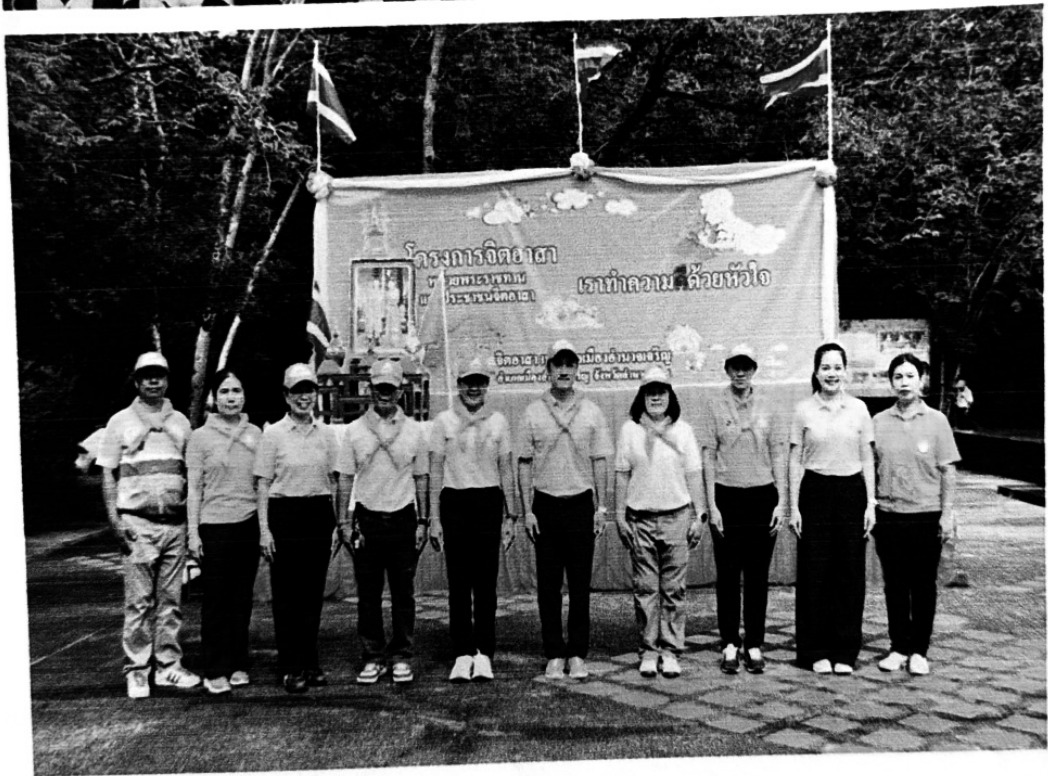
ประธานในพิธีร่วมถ่ายภาพกับจิตอาสา